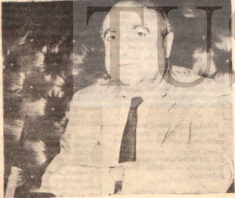
İçişleri Bakanı Hıfzı Oğuz Bekata Galip sayılır, bu yolda mağlûp

Bu muhalefetin, komünizm korkusundan ileri geldiği söylenir, ama aslında sosyal reformların önlenmesi, komünizmin ekmeğine yağ sürer. Çözülmesi gereken ve beniz tatminkâr bir şekilde çözülmeyen mesele, bir istihlak yapmadan istihlakleri önlemek için siyasi kuvvet dengesinde vuku bulması gerekli değişikliklerin nasıl başarılabileceğidir. Bu iş, dahilde ki sosyal ve ekonomik reformların yardımın temel şartı hâline getirmek suretiyle, Terakki için İttifak projesinde olduğu gibi dış tazyik altında yapılabilir mi? Veya, Çin ilerin beyin yıkama metoduna benzer şekilde, Batının ... anize bir teşebbüsüyle, az gelişmiş ülkelerdeki hâkim sınıfları siyasi eğitimden geçirmek mümkün olur mu? Tarihte bunun örneği var mı? XIX. yüzyıl İngilteresi bunun örneğini vermiştir. Bu memleketlerde sosyal istikrarı sağlamak amacıyla, hâkim sınıflar, gönüllü olarak imtiyazlarından vazgeçmişlerdir. İngiliz hâkim sınıfları uzun vâdelli menfaatlerini, insiyaki şekilde doğru olarak değerlendirdi, bunu yapabildi. Fakat böyle bir insiyaki sahip bulunduğunun en ufak işareti vermiyen hâkim sınıflara, bu vasıf kazandırılabilir mi?