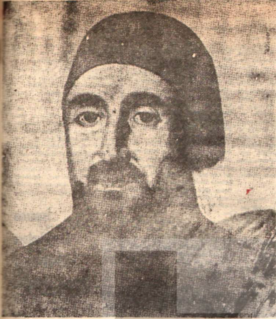
Resit Paşa Açık kapı siyaseti